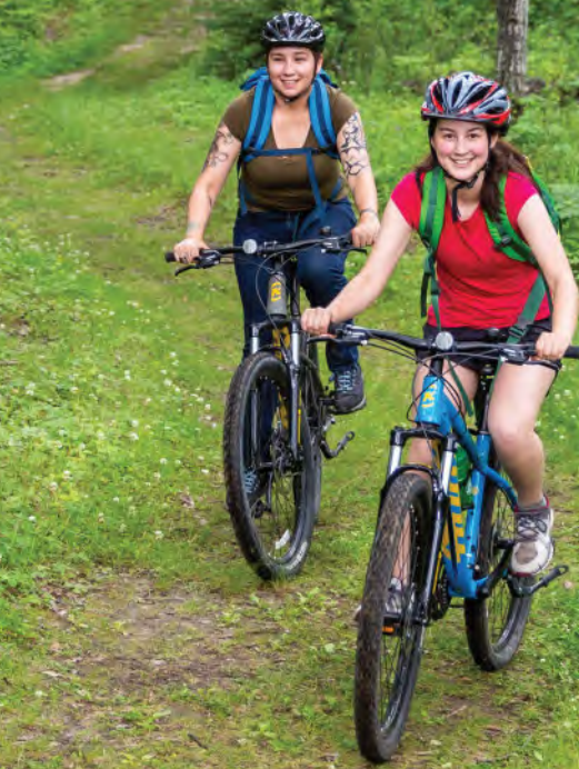
Also available in English.